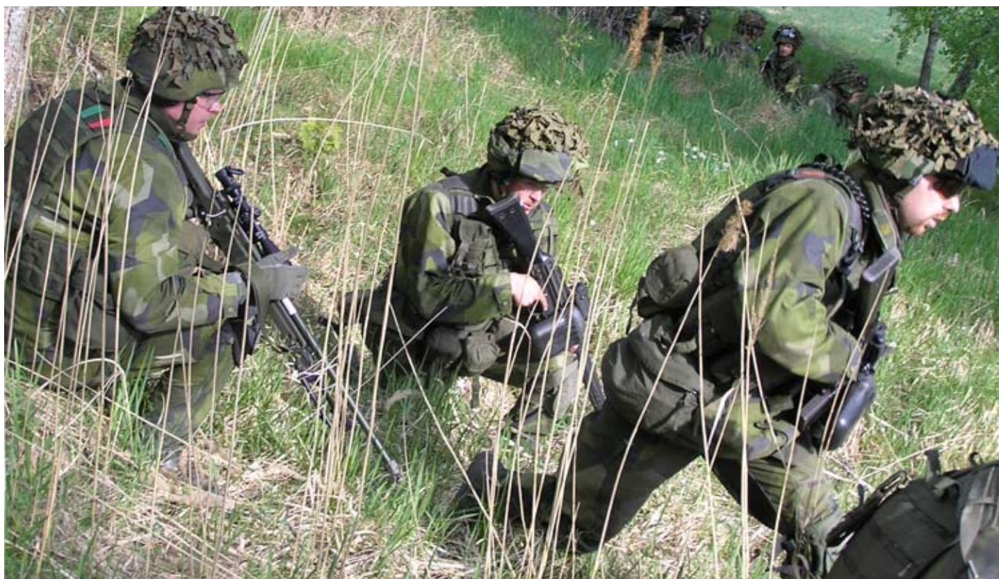
Framryckande vid tagande av objekt. Soldaterna ur 13 Insatskompaniets första pluton.