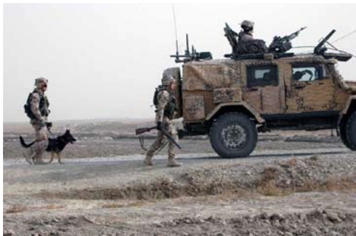
Vid förbandet FS 20 har hundekipage tjänstgjort under insatsen tillsammans med ammunitions och minröjningsgrupperna.

Mot bakgrund av de ökade attackerna med hemmagjorda bomber mot de internationella och afghanska säkerhetsstyrkorna beslutade Försvarsmakten att tillföra ammunitions- och vapensökande hundar till den svenska Afghanistanstyrkan. Efter försöksverksamhet under vintern 2009-10 valde man att permanenta förmågan. Under vintern 2010-2011 har därför hundekipage tjänstgjort i Afghanistan. När hundekipage lagts till förbandets sökförmåga kan enheter ur förbandet framrycka fortare eftersom hastigheten i sökandet av t.ex. en väg ökar.