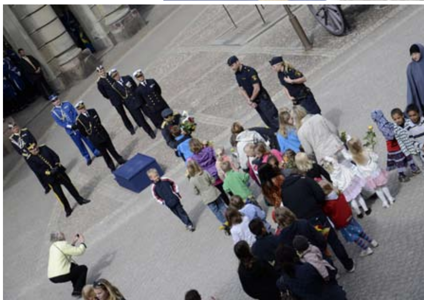
Livgardet deltog som vanligt vid firandet av kung Carl XVI Gustaf på Yttre borggården Valborgsmässoafton.